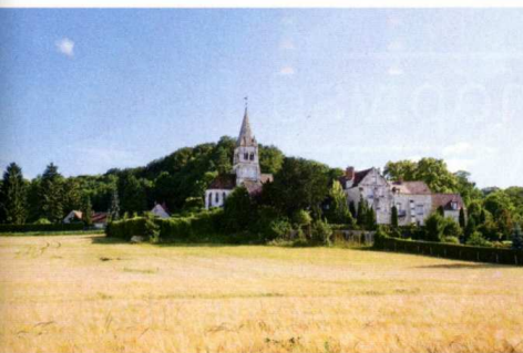
LA FIN D'UN PAYSAGE BUCOLIQUE? Le site industriel sera situé à 550 mètres de l'église médiévale de Saint-Vaast-de-Longmont.

Dans son jardin à l'anglaise, David Long a cessé de se poser ce genre de question. Sept heures durant, tous les jours, il œuvre pour stimuler le processus démocratique. Le jour de clôture de la consultation publique ouverte à l'occasion de la modification du plan local d'urbanisme (PLU) de Verberie pour la transformation des terres agricoles en surface industrielle, les chiffres ont parlé : 700 lettres et 228 pages de commentaires. La plupart débutant par la même formule : « Je m'oppose à la centrale... » suivi d'arguments. De mémoire d'enquêteur, Claude Miqueu n'avait jamais connu une telle mobilisation populaire. Sera-t-elle suffisante? ■