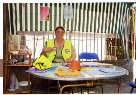
SOLIDARITÉ. Pour assurer la permanence de l'association, le dentiste de Verberie a prêté un carré de son jardin aux militants.