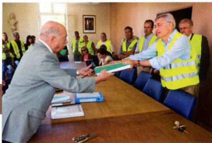
MOBILISATION. Vêtus de leurs gilets jaunes, les associatifs assistent à la clôture du plan local d'urbanisme, à Verberie.